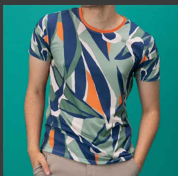
Ropa para dama, caballero y niños con diferentes estilos.