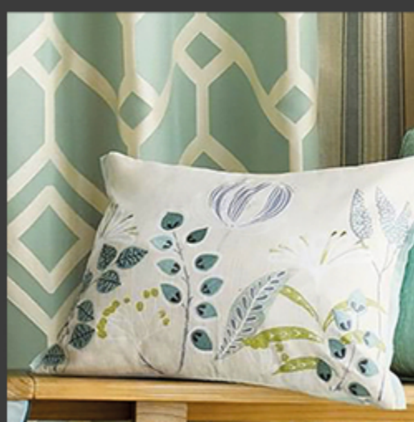
Almohadas y detalles de hogar.