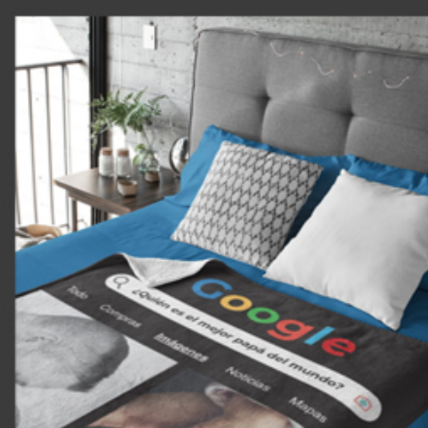
Ropa para cama.