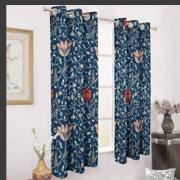
Cortinas y decoración de interiores.