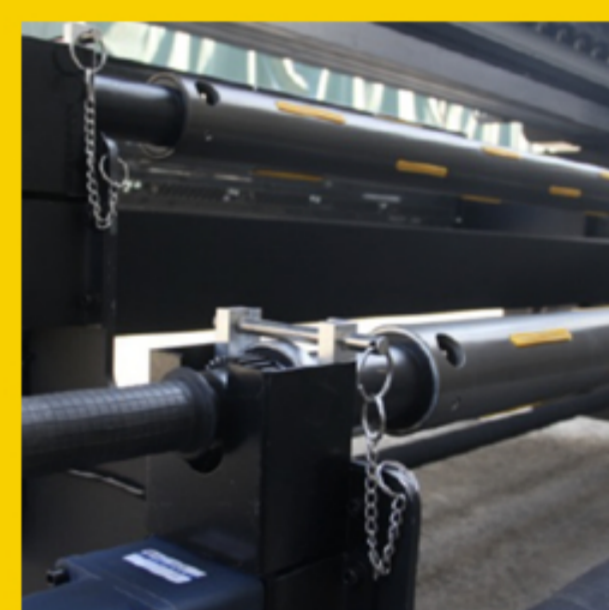
Tubos de agarre dobles inflables profesionales para un transporte estable del material.