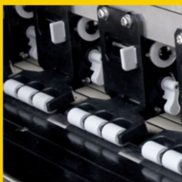
Rodillo de arrastre de triple rueda para asegurar un transporte suave del material.