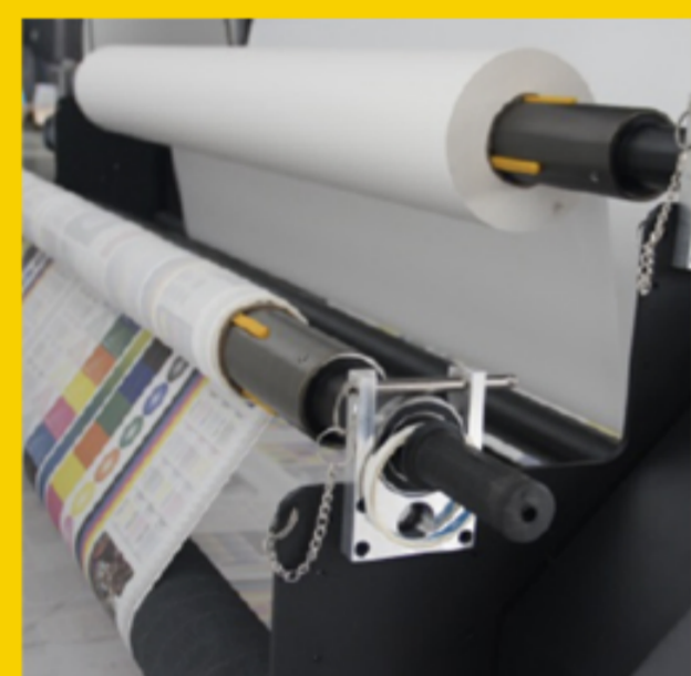
Doble motor semindustrial de alta resistencia en el sistema de recogida y alimentación para ofrecer una impresión ininterrumpida.