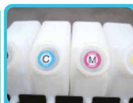
Depósitos de tinta ideales para ahorrar dinero sin cartuchos

Adquiérelolo con el respaldo de la marca Color Make® , Te capacitamos y te entrenamos para que comiences a producir inmediatamente. Nuestras tintas cuidan tu cabezal. Contamos con repuestos y técnicos especializados.