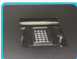
Sistema avanzado de recubrimiento