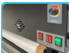
Secado por ventilación y por infrarojo