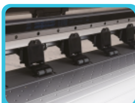
Plataforma de succión