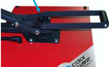
Tornillo de Presión

Oprima nuevamente el botón de selección y coloque de opción de Tiempo "ST". Y presione el botón de "Increase" para subir o "Decrease" para bajar el tiempo de exposición, hasta colocar el tiempo de exposición deseado.