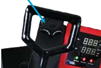
Tornillo de Presión

Oprima nuevamente el botón de selección y coloque de opción de Tiempo "ST". Y presione el botón de "Increase" para subir o "Decrease" para bajar el tiempo de exposición, hasta colocar el tiempo de exposición deseado.