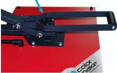
Tornillo de Presión

Oprima nuevamente el botón de selección y coloque de opción de Tiempo " ST ". Y presione el botón de "Increase" para subir o "Decrease" para bajar el tiempo de exposición, hasta colocar el tiempo de exposición deseado.